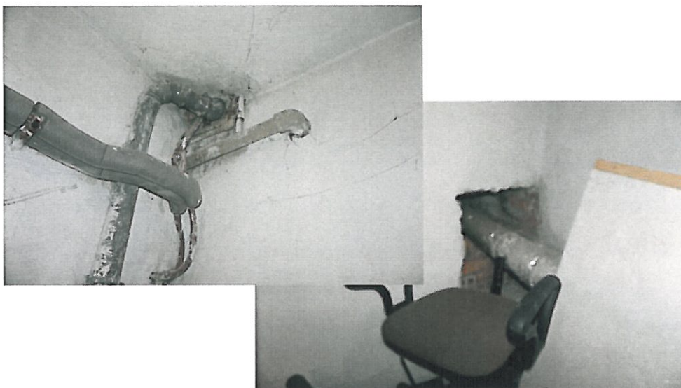
fot 2.) Nie obudowane przepusty instalacyjne w pomieszczeniu wentylatorni (opracowanie własne)

W przedmiotowym budynku nie zostały spełnione wymagania z § 234 ust. 1 rozporządzenia [1] dotyczące klasy odporności ogniowej przepustów instalacyjnych przechodzących przez ściany i stropy w pomieszczeniu wentylatorni.