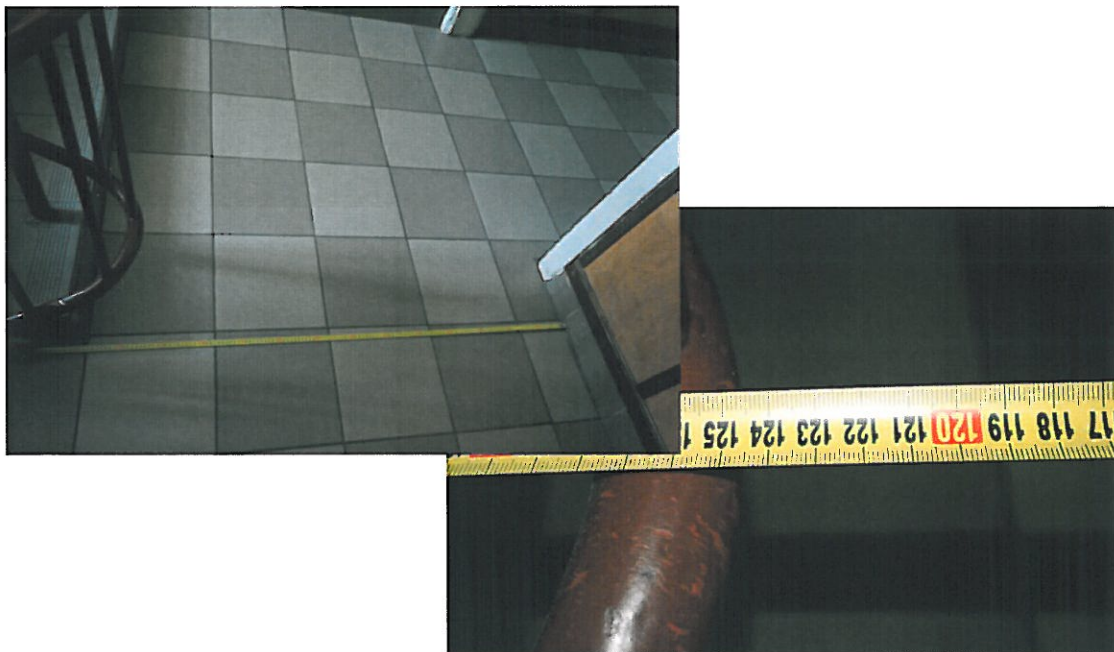
fot. 5. Szerokość użytkowa spocznika klatki schodowej K3 wartość 1,25 m.