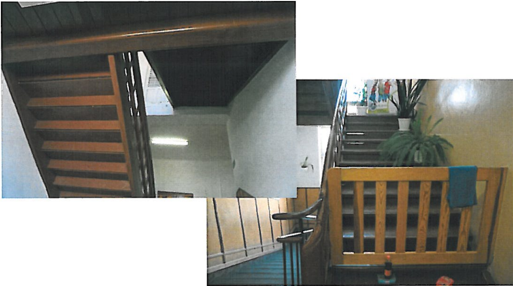
fot 1.) Schody drewniane klatka schodowa K2 (opracowanie własne)

Ponadto w przedmiotowym budynku nie zostały spełnione wymagania z § 249 ust. 3 rozporządzenia [1] dotyczące biegu i spoczników schodów (klatka schodowa K2 z I piętra na poddasze (nie spełniony parametr R 60).