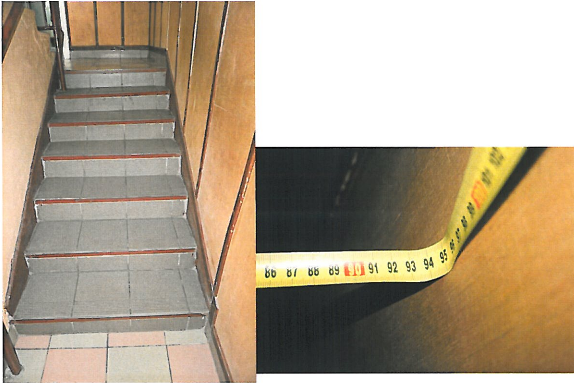
fot. 4. Szerokość użytkowa biegów klatki schodowej K3 wartość 0,94 m. (opracowanie własne)