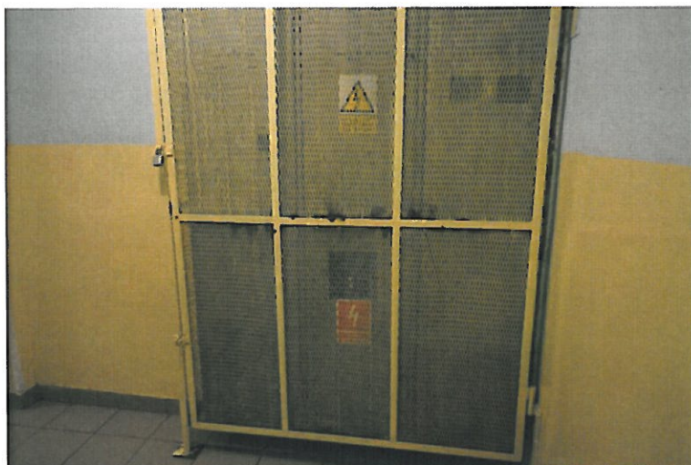
fot. 8. Przeciwpowozarowy wylacznik prądu (opracowanie własne)