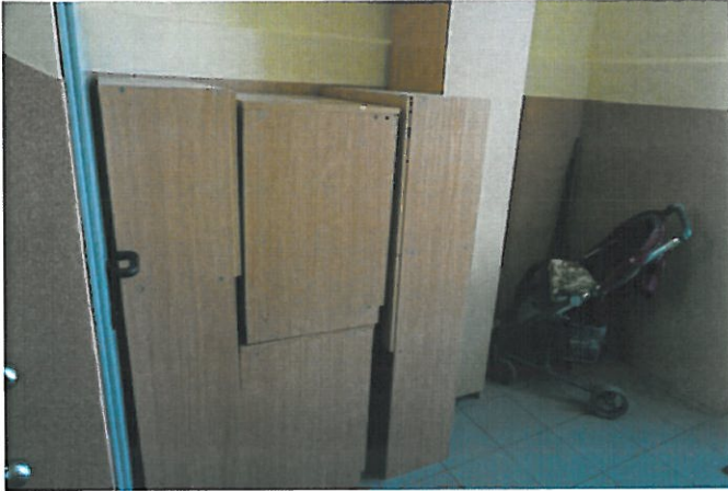
fot 3.) Występowanie materiałów łatwo zapalnych na drogach ewakuacyjnych