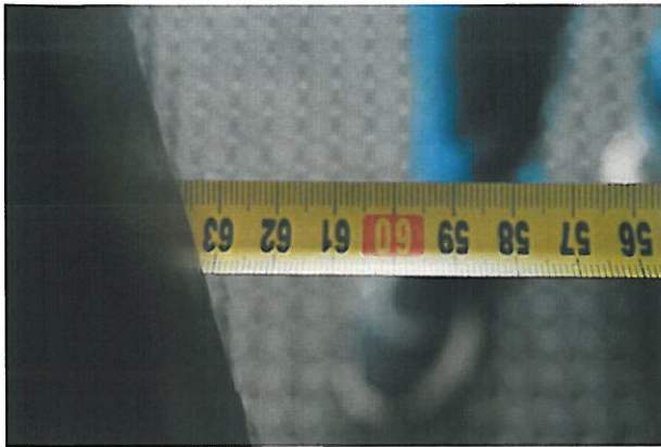
fot. 6. Szerokość drzwi ewakuacyjnych na zewnątrz budynku – skrzydło nieblokowane 0,63 m (opracowanie własne)